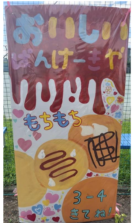
3年4組 おいしいパンケーキ屋