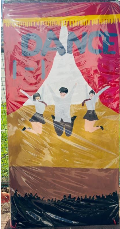
1年1組 ダンス(メドレー)