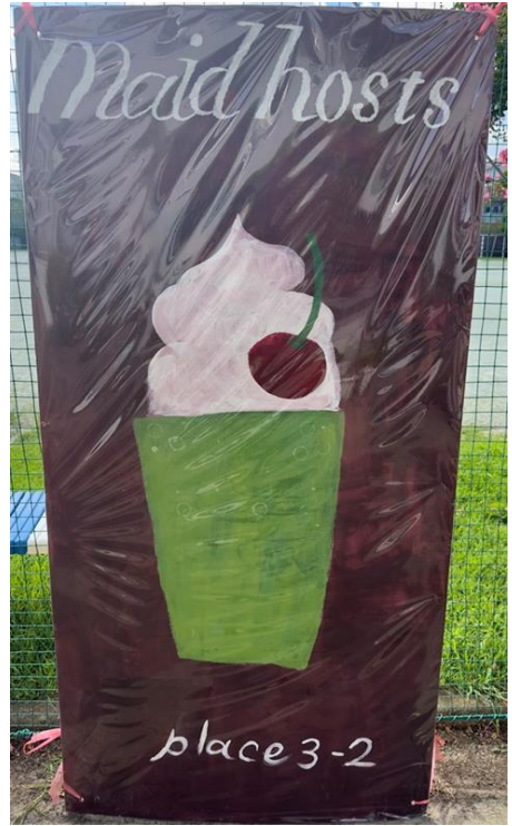
3年2組 メイドホストクラブ