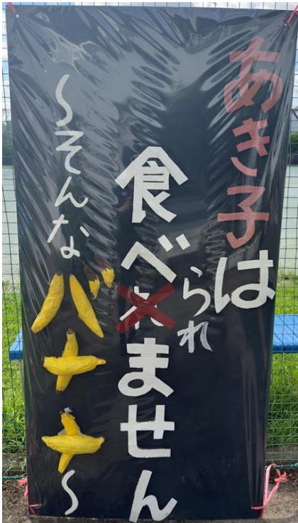
3年3組 アキコちゃんは食べられません そんなバナナ!?