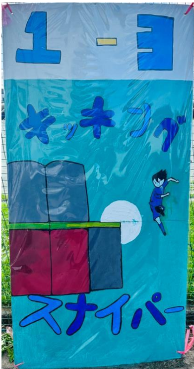
1年3組 キッキングスナイパー