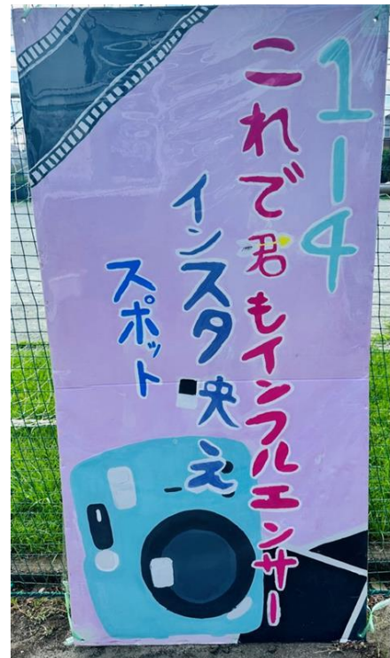
1年4組 これで君もインフルエンサー インスタ映え映えスポット♡