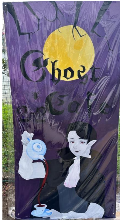
2年2組 Ghost Café