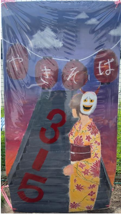
3年5組 般若(やきそば)