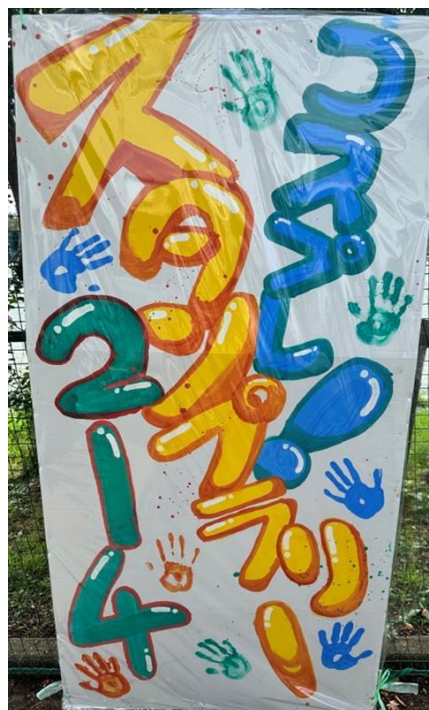
2年4組 コスプレスタンプラリー