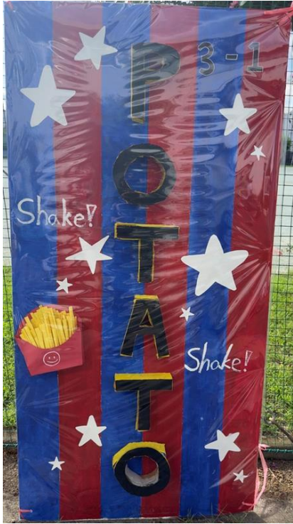
3年1組 Shaking Potato