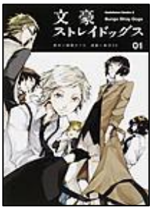
『文豪ストレイドッグス』 朝霧 カフカ原作、春河 35漫画 角川書店